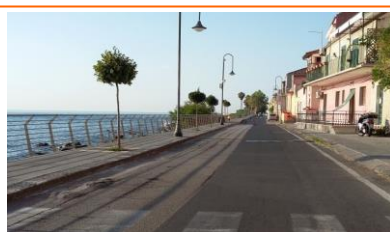
PARTENZA + LUNGOMARE

PER INFORMAZIONI TELEFONARE AL 333 44 65 938