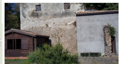
ARRIVO + FORTEZZA DEL TOCCO